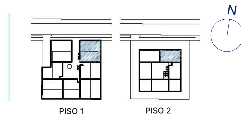
PLANO PISO 1