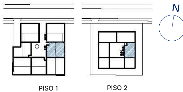
PLANO PISO 1