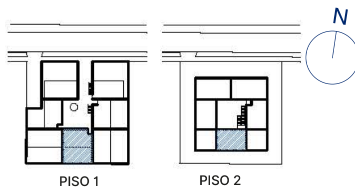
PLANO PISO 1