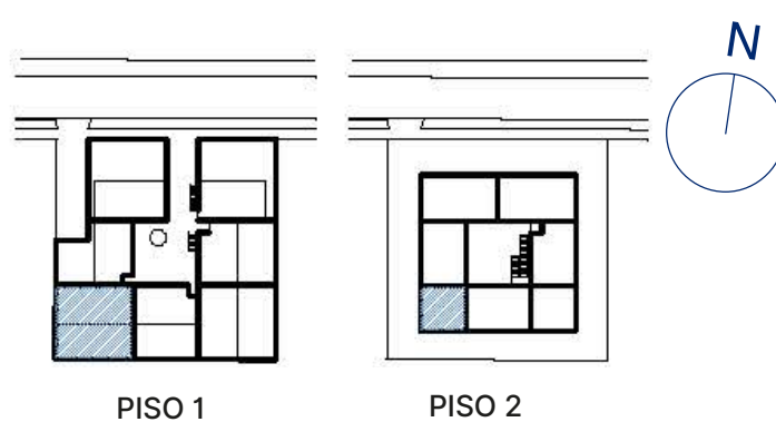
PLANO PISO 1